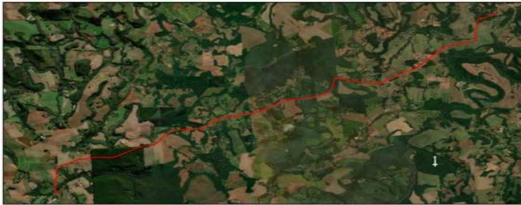
Figura 1: Trecho a ser pavimentado.