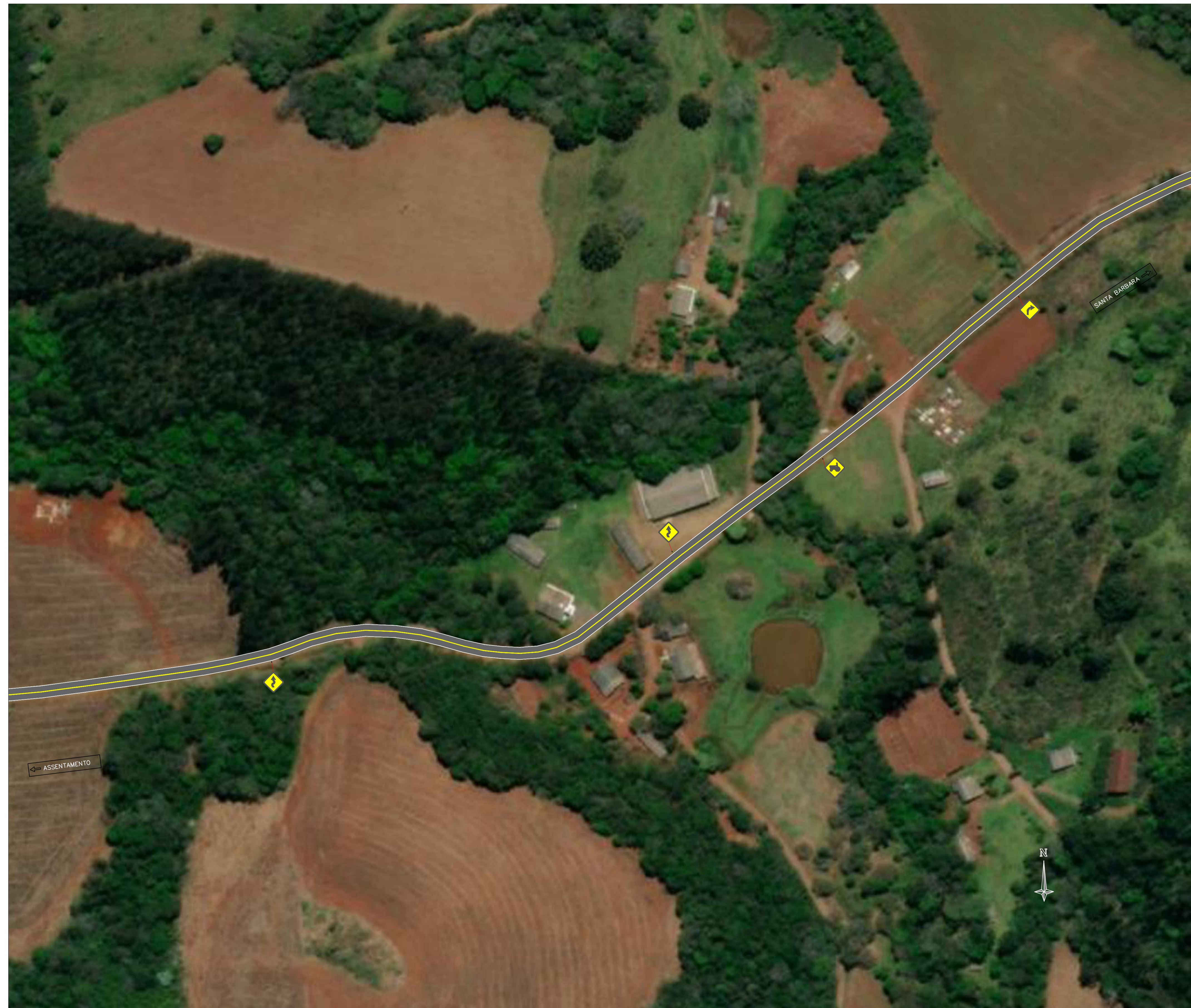
PLANTA DE IMPLANTAÇÃO - TRECHO 11 ESCALA 1:1000