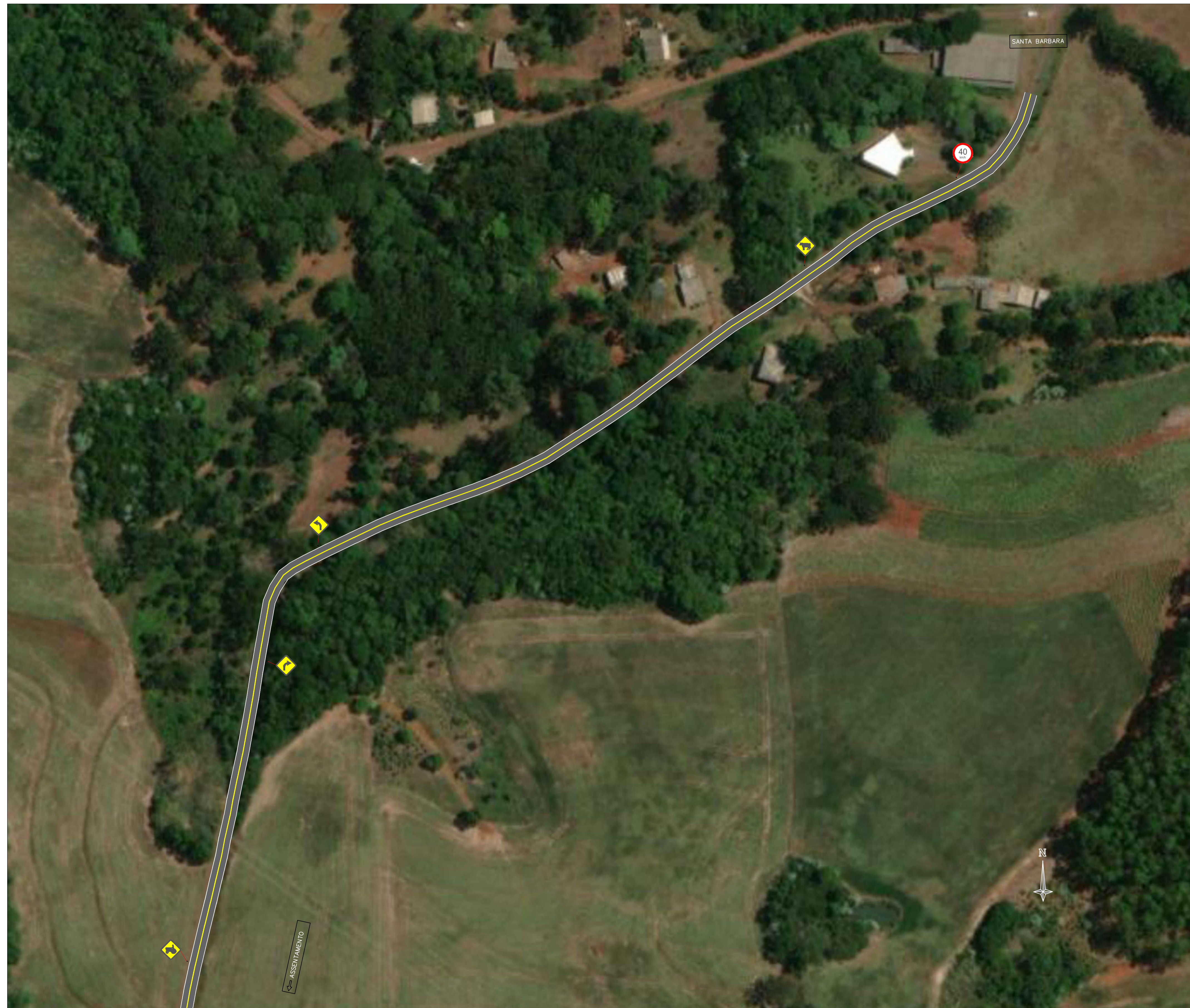
PLANTA DE IMPLANTAÇÃO - TRECHO 01 ESCALA 1:1000