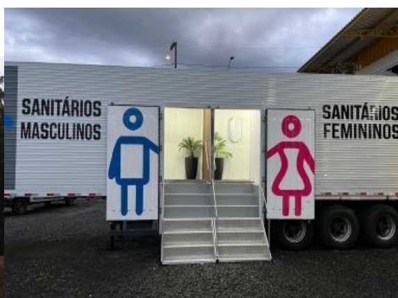
Imagem ilustrativas das carretas sanitárias.