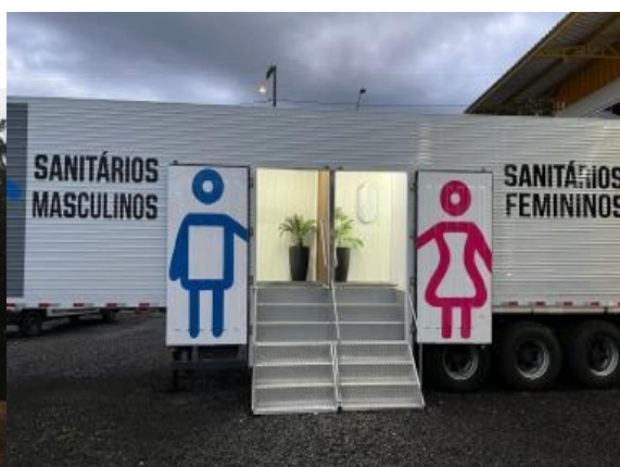
Imagem ilustrativas das carretas sanitárias.