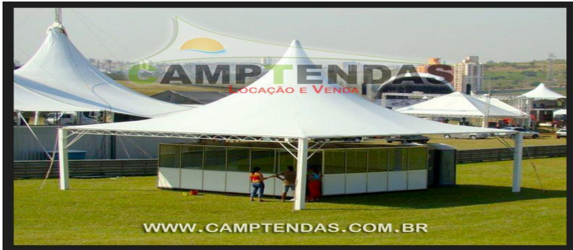
Imagem ilustrativas das tendas.

Rua Octaviano Teixeira dos Santos, 1000 – Caixa Postal 51 - Fone (46) 3520-2121 - CEP: 85601-030 CNPJ 77.816.510/0001-66 - webpage: www.franciscobeltrao.pr.gov.br