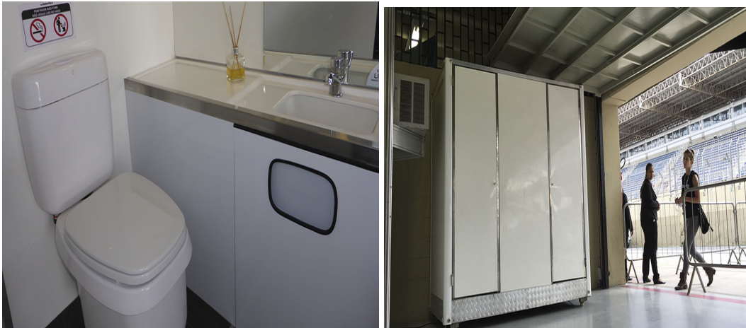
Imagem ilustrativas dos banheiros para camarim.

Rua Octaviano Teixeira dos Santos, 1000 – Caixa Postal 51 - Fone (46) 3520-2121 - CEP: 85601-030 CNPJ 77.816.510/0001-66 - webpage: www.franciscobeltrao.pr.gov.br