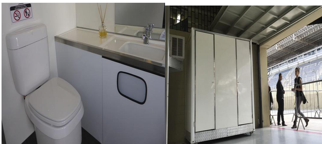
Imagem ilustrativas dos banheiros para camarim.