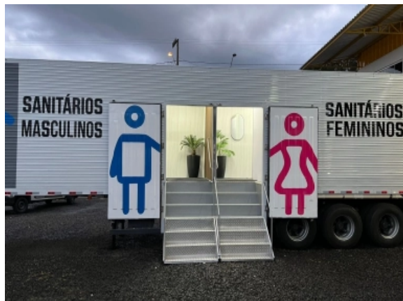
Imagem ilustrativas das carretas sanitárias.