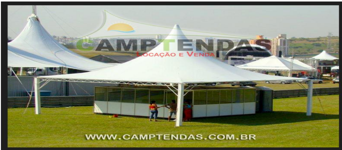
Imagem ilustrativas das tendas.