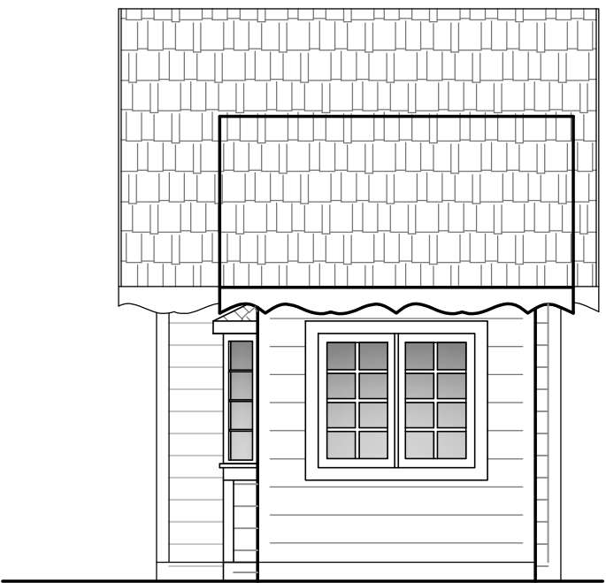
Fachada Lat. Direita 1/50