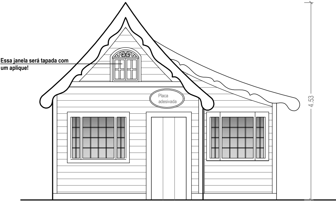
Fachada Frontal 1/50