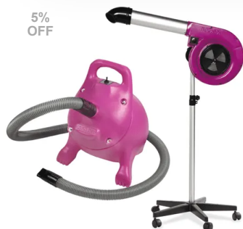
Kit Secador de Pedestal Maestro – Kyklon + Soprador RX – Kyklon Pink