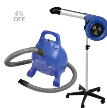
Kit Secador de Pedestal Maestro - Kyklon + Soprador RX - Kyklon Azul

R$ 2.134,00 em até 10x de R$ 213,40 sem juros