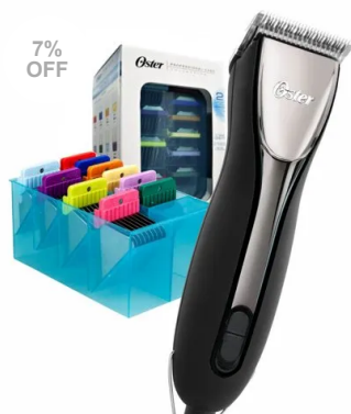
Máquina de Tosa Profissional Oster A6 Slim + Jogo Adaptadores de Metal Oster - Combo

ES e RJ: Não possui Diferença de Alíquota (DIFAL). Não possui Substituição Tributária (ST).