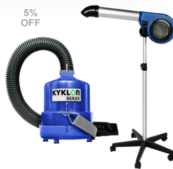
Kit Secador de Pedestal 5000 – Kyklon + Soprador Maxx – Kyklon Azul