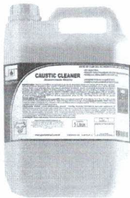
Caustic Cleaner Desincrustante Alcalino - 5 Litros - Spartan