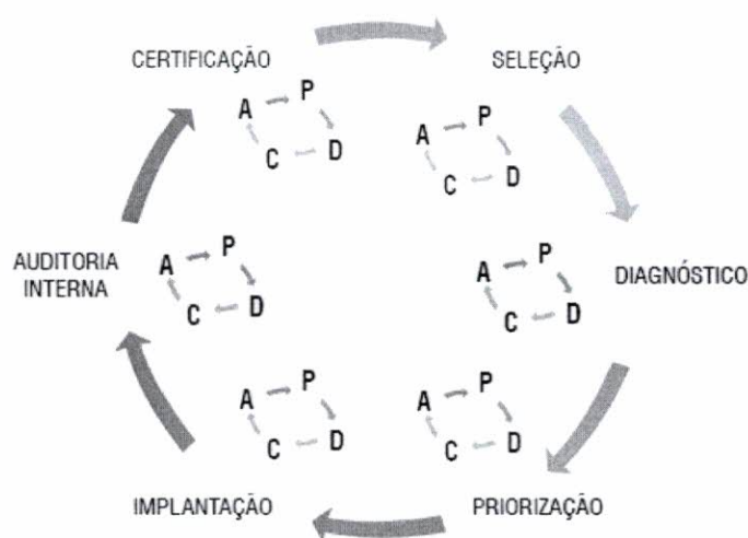
Figura 1 - Metodologia de Implantação CERNE

Para cada evolução de fase, o Cerne orienta que seja rodado o ciclo do PDCA, consolidando os resultados e planejando a próxima fase.