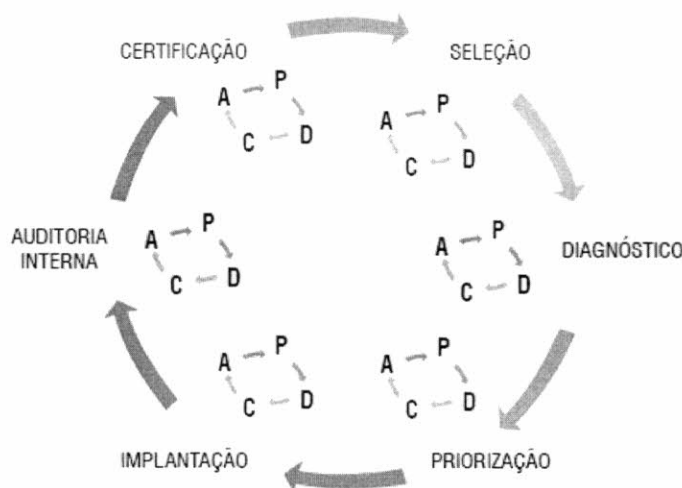
Figura 1 - Metodologia de Implantação CERNE

Para cada evolução de fase, o Cerne orienta que seja rodado o ciclo do PDCA, consolidando os resultados e planejando a próxima fase.