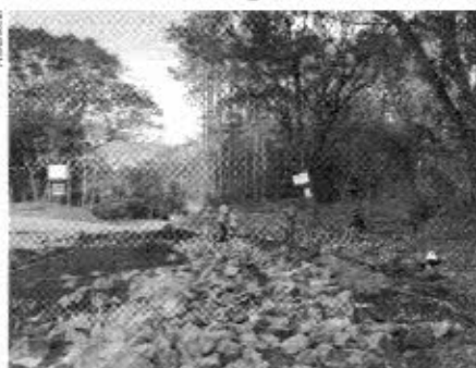
A primeira etapa do serviço está sendo feita.

Enquanto as obras estiverem em andamento o acesso será por meio de um desvio através da Linha São Paulo. A previsão é que em seis