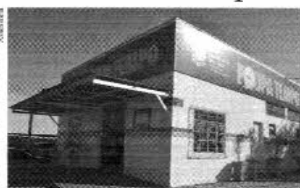
A unidade do Poupa Tempo do Bairro Pinheirinho, na Avenida Atilio Fontana, em frente à Associação dos Motoristas.