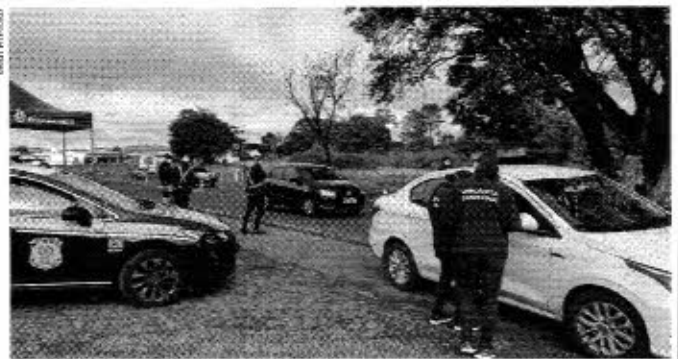
As barreiras, instaladas nas entradas da cidade, terão atuação conjunta da Secretaria Municipal de Saúde, Polícia Rodoviária Federal e agentes do Depatran

As barreiras irão monitorar a entrada das pessoas ao município, com medição de temperatura e razão da visita. O trabalho será uma ação conjunta da Secretaria Municipal de Saúde, com apoio do Departamento de Trânsito (Depatran), Polícia Rodoviária Federal e Polícia Militar.