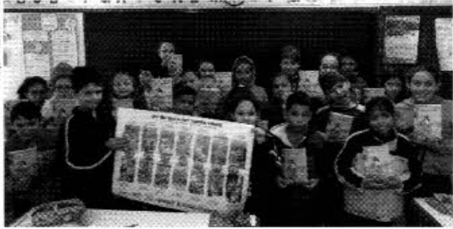
Os direitos das crianças estão expressos na Constituição de 1988.

Trabalho infantil foi tema de projeto abordado na rede municipal de ensino de Francisco Beltrão.