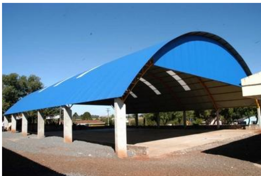
QUADRA COBERTA - ESCOLAS MUNICIPAIS