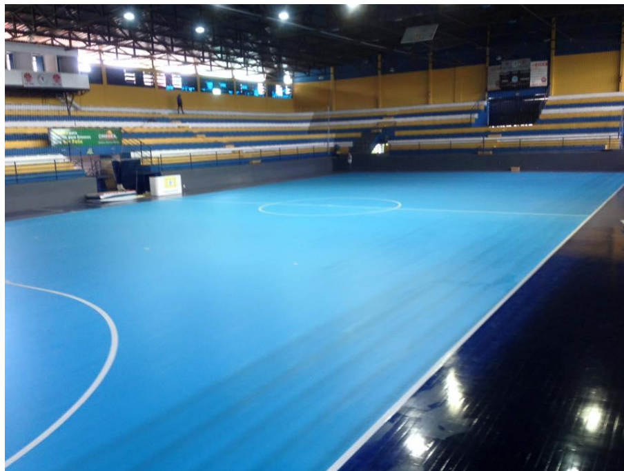
IMAGEM INTERNA DO GINÁSIO DE ESPORTES ARRUDÃO

Além destes campos de futebol, acima citados, existem mais de 100 quadras abertas e campos de futebol "society" de grama natural e sintética, públicos e privados a disposição da população do município.