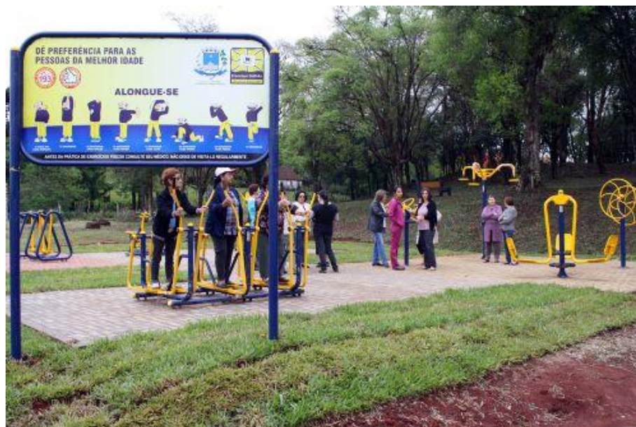
ATI - ACADEMIA DE TERCEIRA