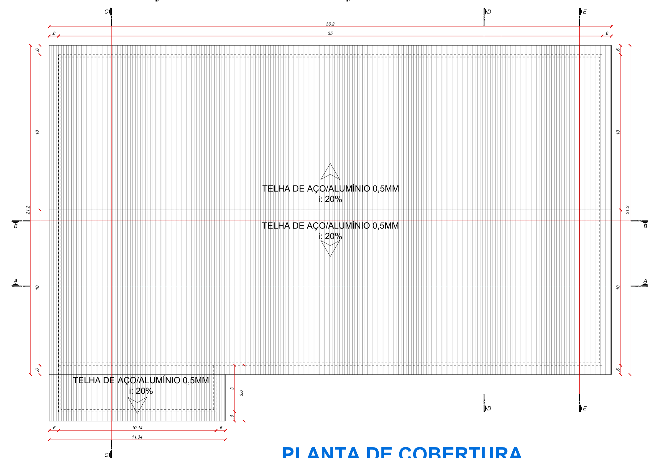
PLANTA DE COBERTURA ESCALA: 1/150

SECRETARIA MUNICIPAL DE PLANEJAMENTO SEPLAN IPPUB Departamento de Informação Pesquisa e Planejamento Municipal