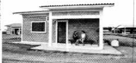
Recenseador entrevista mulher em propriedade rural.

mas. O importante papel da agricultura familiar na produção agropecuária do País será investigado mais uma vez. Os resultados do Censo Agro 2017 devem começar a ser divulgados pelo IBGE em meados de 2018.