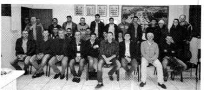
Com frequência, a Câmara de Manfrinópolis lota com a participação da comunidade.

Neste primeiro ano de gestão, os nove vereadores eleitos em Manfrinópolis trabalham com dois grandes objetivos. Além de buscar em consenso aprovar requerimentos que são relevantes à população, os vereadores trabalham também para firmar o desmembramento da Câmara com a Prefeitura.