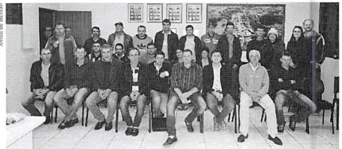
Com frequência, a Câmara de Manfrinópolis lida com a participação da comunidade.

No entanto, os vereadores afirmam que isso não significa fazer oposição, mas sim um trabalho independente que some para o bem de Manfrinópolis. Com frequência, a Câmara recebe o prefeito e outros representantes do poder Executivo para, através do