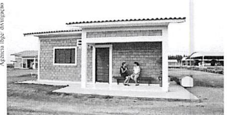
Recenseador entrevista mulher em propriedade rural.

O Instituto realizou dois processos seletivos simplificados para os temporários que atuarão no Censo Agropecuário 2017. Mais de 130 mil pessoas se inscreveram para concorrer a 26.010 vagas, das quais 171 para profissionais de nível superior em 18 diferentes áreas de conhecimento, para o cargo de Analista Censitário. As demais vagas foram para nível médio (6.139, destina-