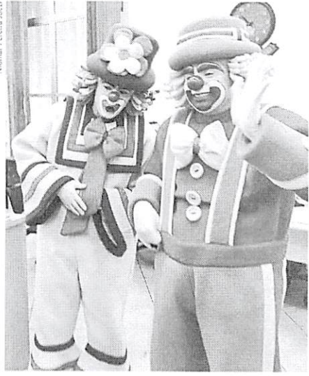
Visita na redação do Jornal de Beltrão na tarde de ontem.

É a segunda vez que eles se apresentam em Beltrão. A primeira foi há cerca de cinco anos, no centro de eventos. A carteira da dupla que leva alegria às crianças e aos papais é formada por vários CDs, programas de TV, site com várias atrações e brinquedos.