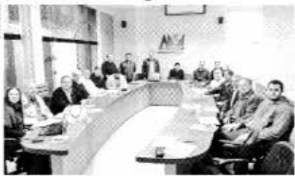
Parceria entre a Amsop e o Irdes no projeto Sudoeste 2030 reuniu representantes de municípios da região.